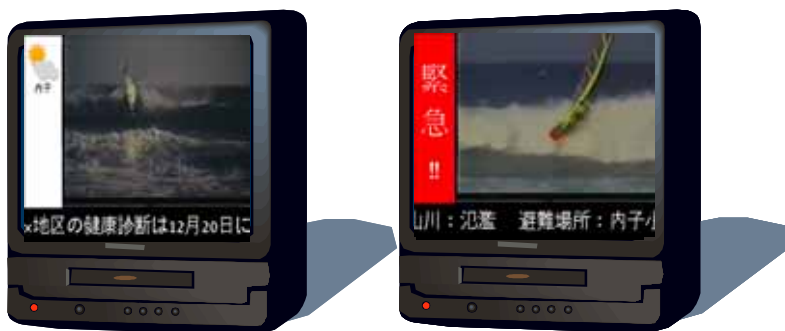
画面表示イメージ